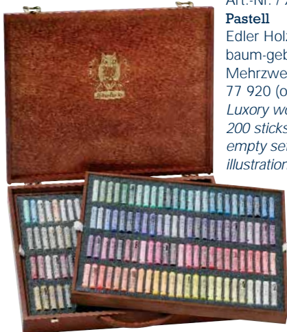
Art.-Nr. / Art.-No. 77 200 Pastell Edler Holzkasten, nussbaumgebeizt, 200 Stifte, Mehrzweck, als Leerkasten: 77 920 (ohne Abb.) / Luxury wooden set, 200 sticks, multi-purpose, empty set: 77 920 (without illustration)