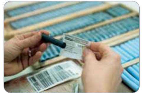
Handetikettierung der Schmincke Pastelle Handlabelling of Schmincke pastels