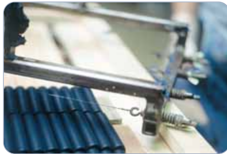
Drahtbespannter Rahmen zum Schneiden der Pastelle Wire-strung frame for cutting the pastels