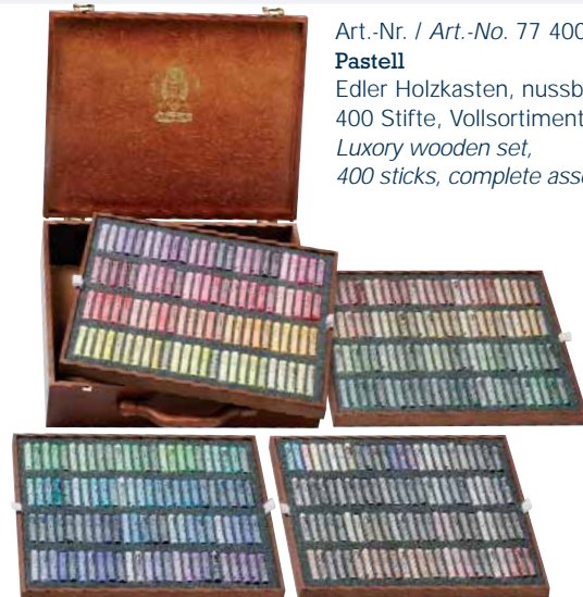
Art.-Nr. / Art.-No. 77 400 Pastell Edler Holzkasten, nussbaumgebeizt, 400 Stifte, Volls Sortiment / Luxury wooden set, 400 sticks, complete assortment

Wir behalten uns vor, die Bestückung der Kästen zu verändern.