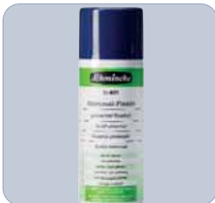
50 401 400 ml Universal-Fixativ / Universal fixative

Universelles Fixativ mit UV-Schutz auf Alkohol-Basis für verschiedene Mal- und Zeichentechniken. Ideales Zwischenfixativ für Kohle, Bleistift, anschließend mit Ölmalerei übermalbar. Schlussfixativ für Kohle, Bleistift, Pastell, Aquarell, Gouache, Kunstdruck, Ink-Jet-Ausdrucke, Fotos etc. (Vorversuche empfohlen). Das Fixativ trocknet schnell und seidenglänzend auf, ist gilbungsbeständig und bildet einen, widerstandsfähigen Film. Vor Gebrauch schütteln. Aus 30 – 40 cm Entfernung im Kreuzgang sprühen; nach Trocknung Vorgang wiederholen bis gewünschte Fixierung erreicht ist. Verklebte Sprühköpfe mit Alkohol reinigen. Enthält: Polyvinylharz, UV-Absorber, Alkohole.