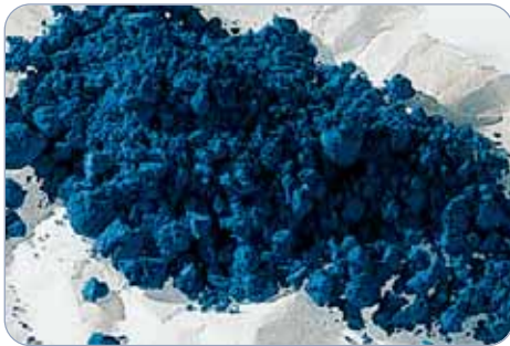
Feinste Künstler-Pigmente Finest artists' pigments

Pastels paintings will always remain sensitive. Therefore, they should only be treated with a special fixative – like Schmincke Pastell-Fixativ (no 50 402) – to be used sparingly. When working on Schmincke " Sansfix " Pastel board – available in 6 colours – no fixative is required unless you do not work in thicker layers.