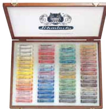
Art.-Nr. / Art.-No. 77 060 Pastell Edler Holzkasten, nussbaumgebeizt, 60 Stifte, Mehrzweck, als Leerkasten: 77 960 (ohne Abb.) / Luxury wooden set, 60 sticks, multi-purpose, empty set: 77 960 (without illustration)