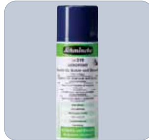
50 310 350 ml AEROPUMP Fixativ für Kohle & Bleistift / AEROPUMP fixative for charcoal & pencil

Alkohol-Fixativ aus gebleichtem Schellack und nicht gilbendem Kunstharz mit hoher Fixierwirkung. Bei geringer Dosierung und wenn Farbtonvertiefung tolerierbar, auch für Pastell geeignet. Stärkere Fixiereinwirkung als Pastellfixativ durch höheren Harzgehalt. Enthält: Schellack und Ketonharz.