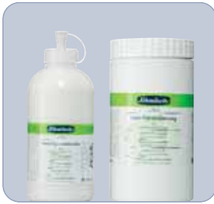
50 503 500 / 1000 ml Pastellgrundierung / Primer for pastels

Lichtechte, fein angeraute, sehr aufnahmefähige Grundierung für Pastell. Lässt völlig problemlos das Verwischen, Verreiben und Mischen übereinandergelegter Farbschichten zu. Vielfältig anwendbar auf fettfreien Materialien wie Holz, Metall, Leinwand, Papier (<300 g/m 2 ), auf schwierigen Untergründen Vorversuche durchführen. Saugende Untergründe mit 50 500 Schmincke Imprägnierung vorbehandeln. Mit Schmincke Acrylfarben einfarbbar. Anwendung: Gebrauchsfertig für die Verarbeitung mit Rolle, für Pinsel mit 10 – 20 % Wasser verdünnen. Auftrag: 2 – 3 Schichten. Trocknet wasserfest auf, mit Aquarell, Gouache und Acrylfarben übermalbar. Gut geeignet für Mischtechnik.