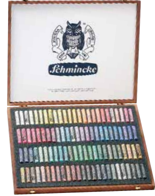
Art.-Nr. / Art.-No. 77 100 Pastell Edler Holzkasten, nussbaumgebeizt, 100 Stifte, Mehrzweck, als Leerkasten: 77 910 (ohne Abb.) / Luxury wooden set, 100 sticks, multi-purpose, empty set: 77 910 (without illustration)