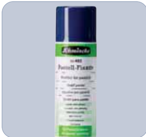
50 402 300 ml Pastell-Fixativ / fixative for pastels

Alkoholhaltiges Zwischen- und Schluss-Fixativ für Pastell und Kreiden mit hoher Fixierwirkung. Farbtonveränderung (gering) hängt von der aufgesprühten Menge Fixativ ab. Enthält: Polyvinylharz.