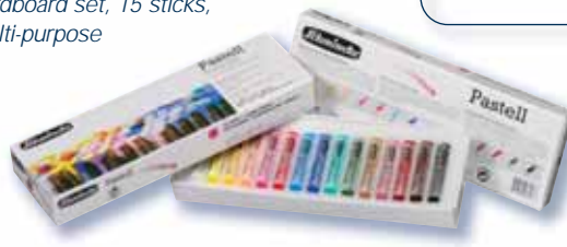
Art.-Nr. / Art.-No. 77 115 Pastell Karton-Set, 15 Stifte, Mehrzweck / Cardboard set, 15 sticks, multi-purpose