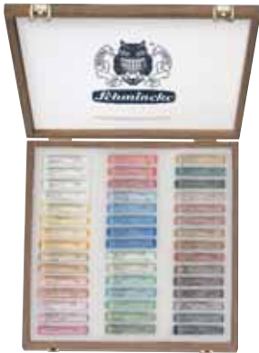
Art.-Nr. / Art.-No. 77 045 Pastell Edler Holzkasten, nussbaumgebeizt, 45 Stifte, Mehrzweck, als Leerkasten: 77 945 (ohne Abb.) / Luxury wooden set, 45 sticks, multi-purpose, empty set: 77 945 (without illustration)