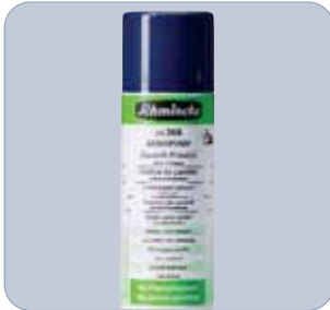
50 368 350 ml AEROPUMP Pastell-Fixativ / AEROPUMP fixative for pastels

Alkoholhaltiges Zwischen- und Schluss-Fixativ für Pastell und Kreiden mit hoher Fixierwirkung. Farbtonveränderung (gering) hängt von der aufgesprühten Menge Fixativ ab. Enthält: Polyvinylharz.