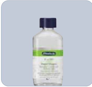
Pastell-Fixativ / Fixative for pastels

Alkoholhaltiges Zwischen- und Schlussfixativ mit hoher Fixierwirkung für Pastell und Kreiden. Farbtonveränderung (gering) hängt von der aufgesprühten Menge Fixativ ab. Mit Fixierspritze auf senkrecht stehendes Bild aus 30 – 40 cm Entfernung aufsprühen. Enthält: Polyvinylharz.