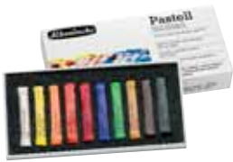
Art.-Nr. / Art.-No. 77 010 Pastell Karton Starter Set, 10 Stifte, Mehrzweck / Cardboard starter set, 10 sticks, multi-purpose